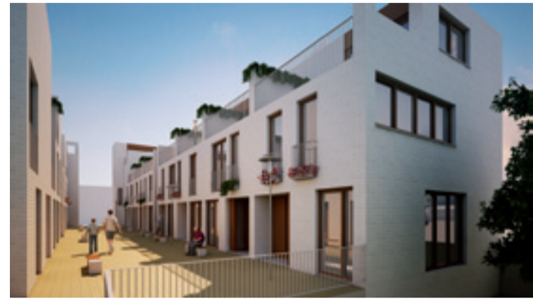
Impressie van DOKtilburg

De woningen liggen aan binnenstraten waardoor de woningen veel rust en privacy hebben. Elke woning heeft een grote daktuin of terras, daarnaast is er een gemeenschappelijke binnentuin. Parkeren kan in de ondergrondse afgesloten parkeergarage. Ook zijn er woningen voor starter(s) en doorstarter(s). De woningen zijn hoogwaardig afgewerkt en worden voorzien van domotica (huisautomatisering).