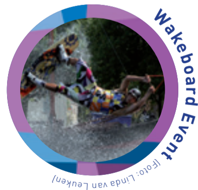
Wakeboard Event