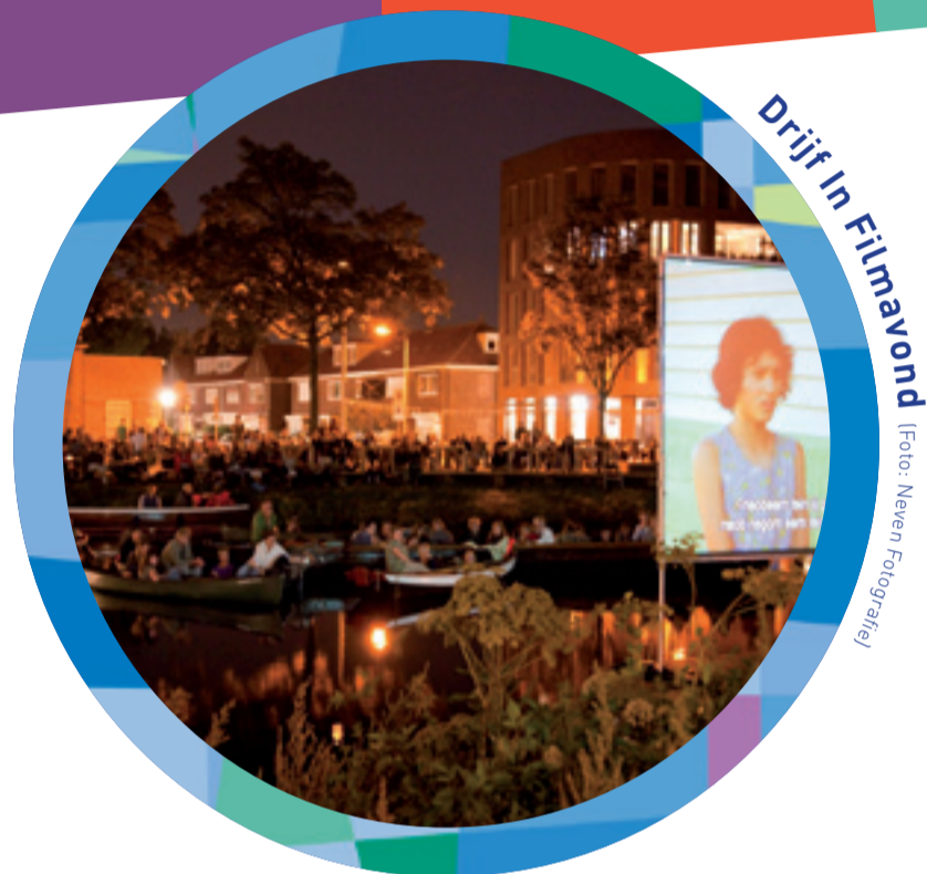
Drijf In Filmavond

Piushaven Levend Podium is een gezamenlijk initiatief van de gemeente Tilburg, Bouwfonds Ontwikkeling, Triborgh Gebiedsontwikkeling, Van der Weegen, Wonen Breburg, Wonen Breburg, Van de Ven Bouw & Ontwikkeling, Bouwinvest, Interfour en Residentie de Admiraal.